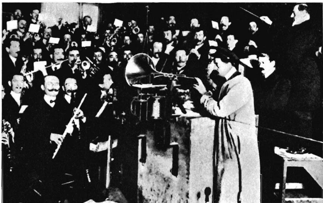
La sala d'incisione di una Casa discografica e (sotto) un concerto al grammofono agli inizi del Novecento.

poi, stranamente, era stata abbandonata dal suo ideatore.