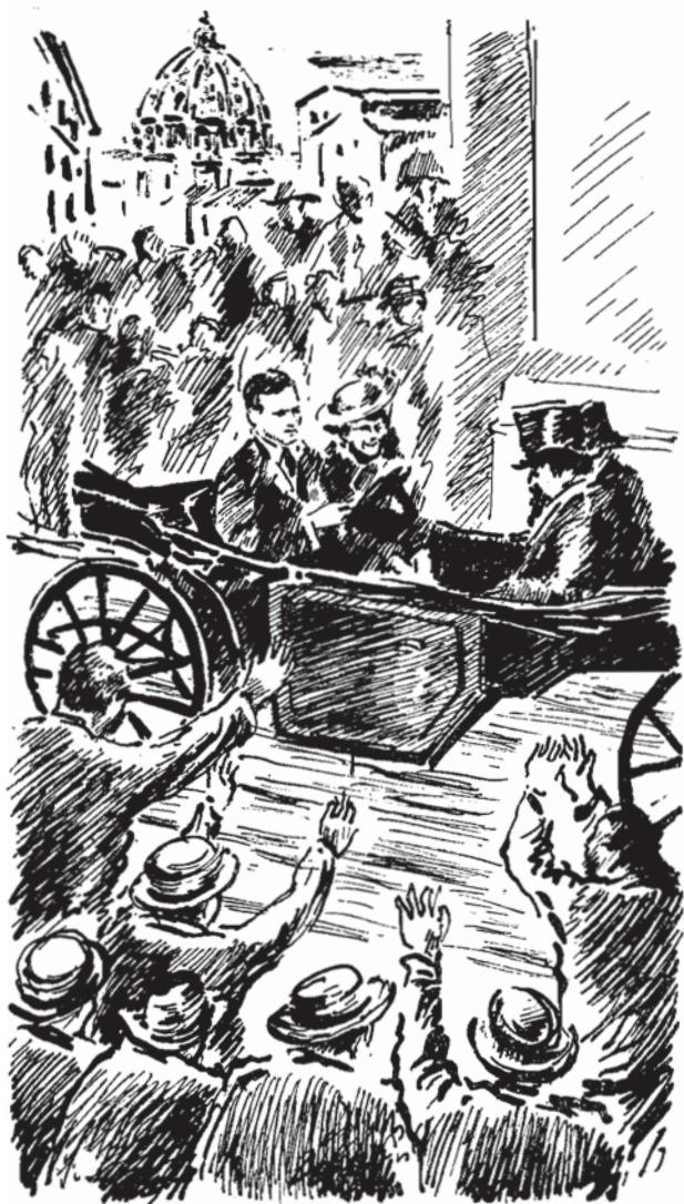
Il Principe Colonna, nella sua qualità di Sindaco andò alla Stazione col cocchio di gran gala.