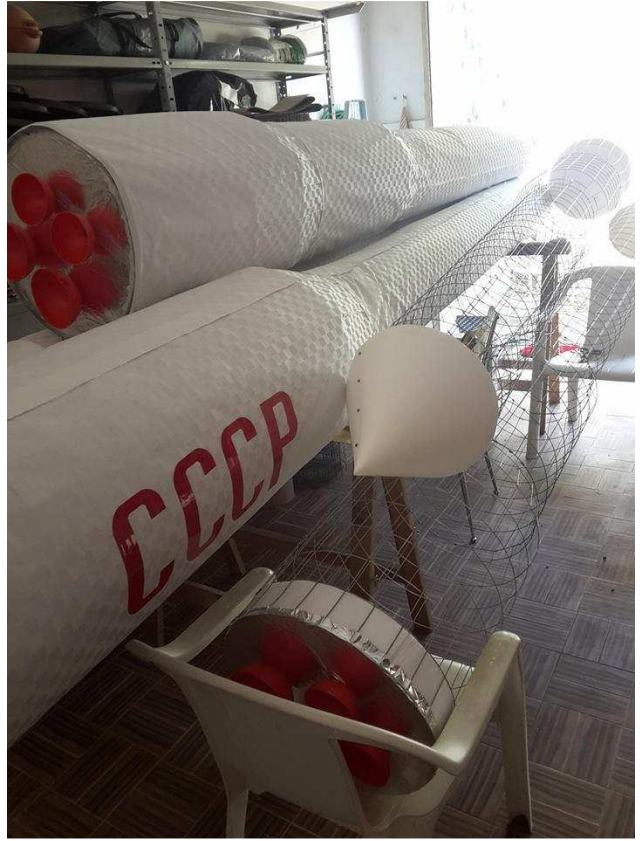
Altre foto delle fasi della lavorazione del missile