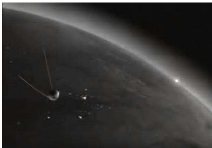
Launch of Sputnik 1 - October 1957

https://www.youtube.com/watch?v=qvPzUAeWZZY&feature=youtu.be