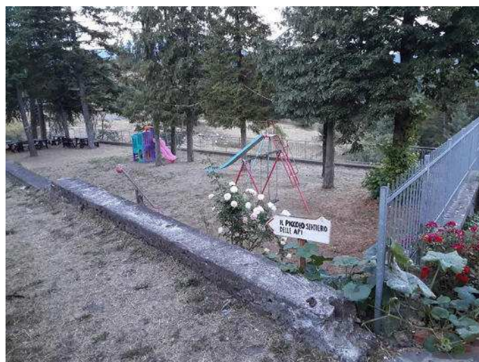
Tavarone (La Spezia) http://www.tavarone.it/

A Tavarone avremo stazioni attive in HF multioperatore nelle varie bande e nei vari modi col nominativo II1MIR ( scelto appositamente per onorare gli Scienziati Russi che per primi realizzarono anche la prima stazione spaziale internazionale e in segno di Pace nel mondo MIR = PACE ) per fare QSO nel mondo.